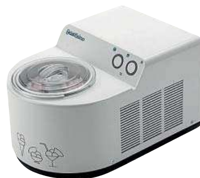
HELADORA que prepara en 30 minutos un helado delicioso y casero. Capacidad para 1,7 litros. Realmente sencillo, [389 €] alambique.com