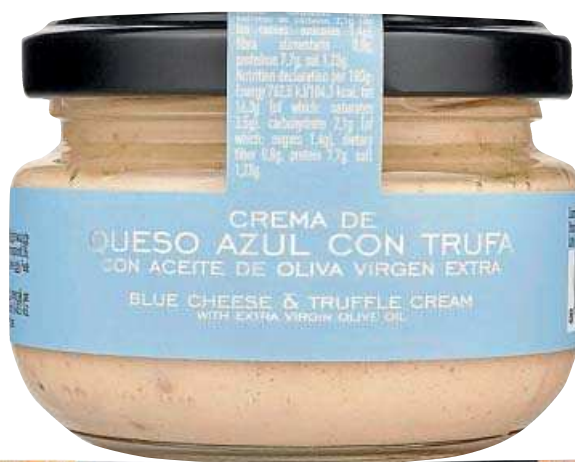
CREMAS de distintos tipos de quesos: cabra con cebolla caramelizada, queso azul con trufa, torta extremeña... [2,50 €] lachinata.es