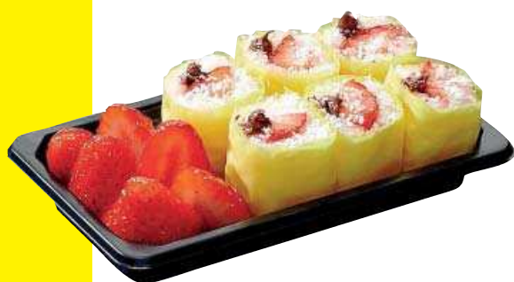
MAKIS de chocolate y fresa. Un postre ligero, divertido y muy original. Su textura es inigualable. [7,50 €] sushidaily.com