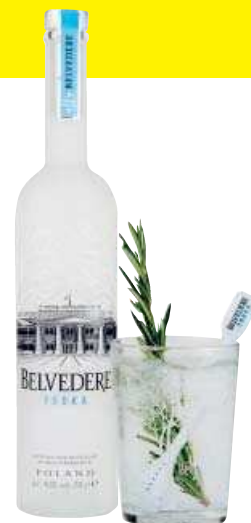
VODKA Belvedere. Es fresco y va muy bien para pasar buenos momentos en casa o de vacaciones con los amigos. [35 €] cellerdegelida.net