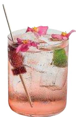
GIN & TONIC con frambuesa y lima. La fiebre por esta bebida ha llevado a los barman a innovar y crear combinaciones como esta. [10 €] mamaframboise.com