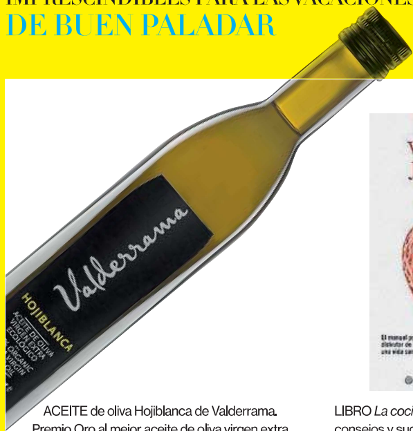
ACEITE de oliva Hojiblanca de Valdeirama. Premio Oro al mejor aceite de oliva virgen extra del mundo. [6,99 €] valdeirama.es